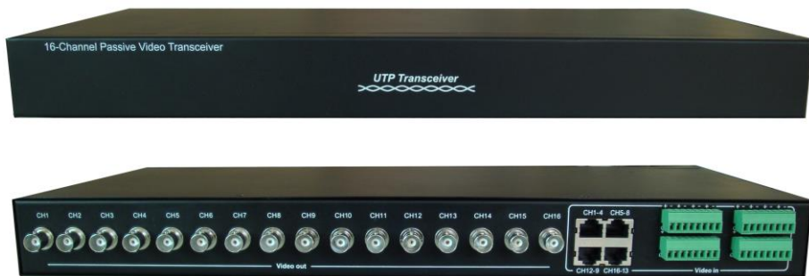
Рис.1 Внешний вид TP-C16