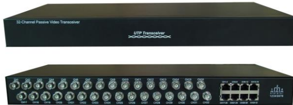
Рис.1 Внешний вид TP-C32 Структурная схема подключения