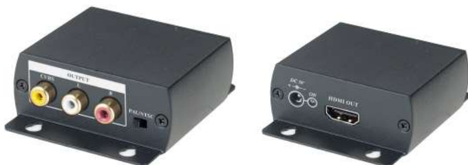
Рис.1 Преобразователь HC01, внешний вид