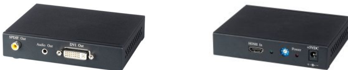
Рис.1 Внешний вид HD01