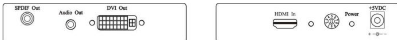
Рис.3 Панель подключения HD01