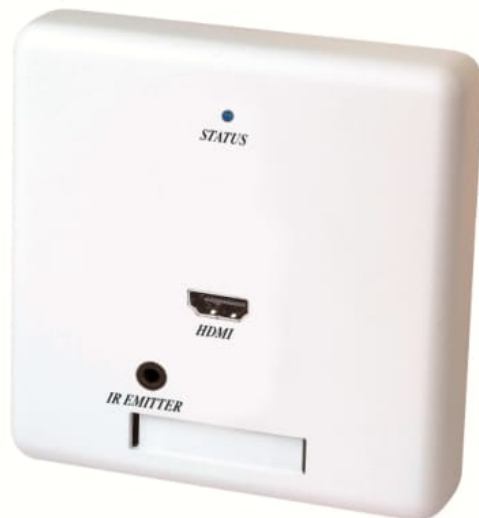
Рис. 1 HW02T.