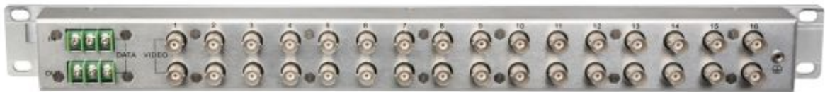
Рис.1 Внешний вид на примере SP-C16D