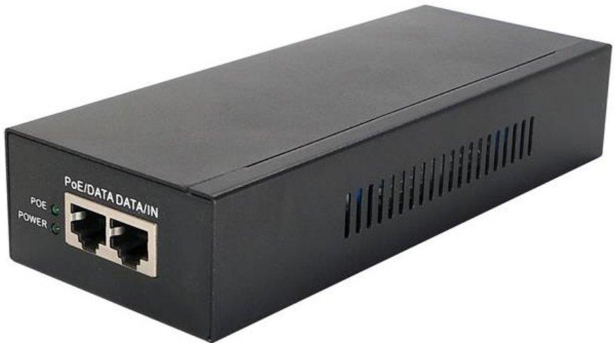
Рис.1 Midspan-1/902G, внешний вид