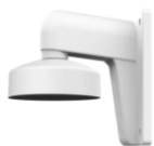
DS-1273ZJ-130-TRL Настенный кронштейн