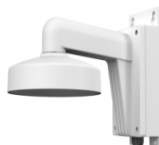
DS-1272ZJ-110B Настенный кронштейн