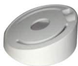
DS-1259ZJ Потолочное крепление